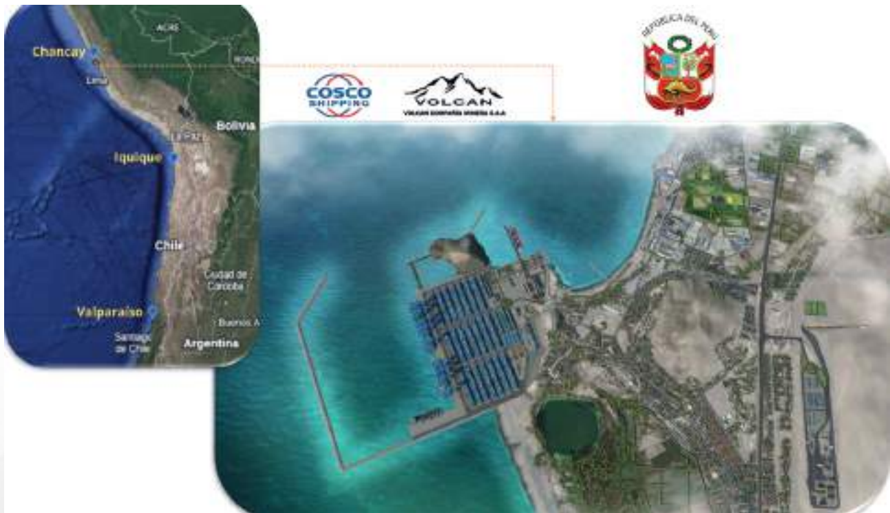
Figura 1. El Puerto de Chancay: Un Objetivo Oceanopolítico peruano

Nota. Composición de propia autoría, basada en Así es el megapuerto de Chancay en Perú que podría poner en aprietos a Chile: el 60% pertenece a China, por B. Haas, 2024, ( https://www.biobiochile.cl/noticias/servicios/explicado/2024/11/14/asi-es-el-megapuerto-de-chancay-en-peru-que-podria-poner-en-aprietos-a-chile-el-60-pertece-a-china.shtml ).