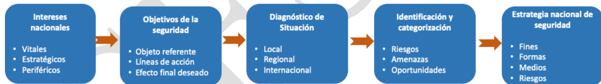
Ilustración 3. Cadena estratégica