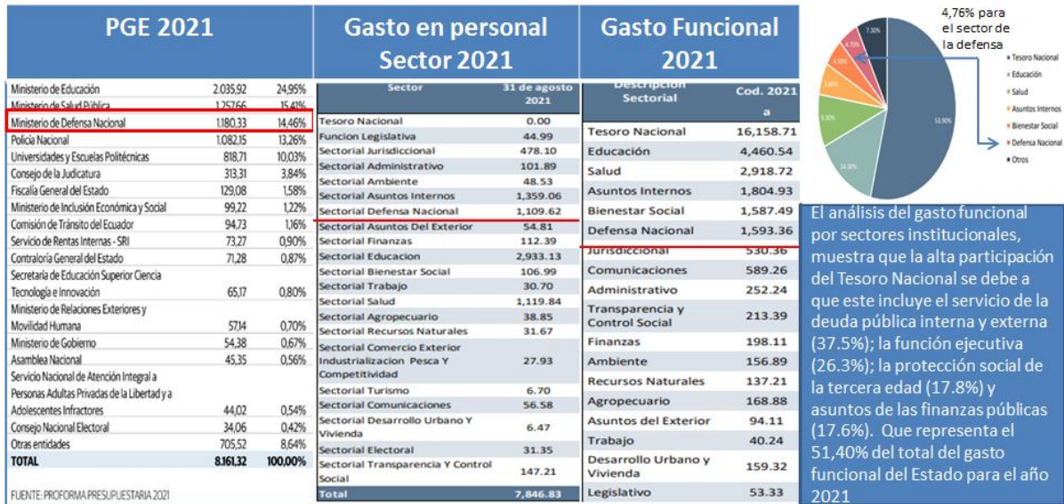
Gráfico N°1 Presupuesto General del Estado 2021

El análisis del gasto funcional por sectores institucionales, muestra que la alta participación del Tesoro Nacional se debe a que este incluye el servicio de la deuda pública interna y externa (37.5%); la función ejecutiva (26.3%); la protección social de la tercera edad (17.8%) y asuntos de las finanzas públicas (17.6%). Que representa el 51,40% del total del gasto funcional del Estado para el año 2021