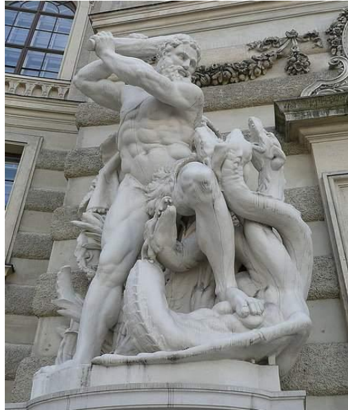
Figura que representa al hijo de Zeus – Hércules, luchando contra la Hidra de Lerna, monstruo de varias cabezas.

derechos de las personas, sin avanzar a una respuesta integral e integrada, el accionar de estos grupos va sumando nuevas capacidades y mayor alcance, diversifica las rutas, contamina territorios 19 . Nos encontramos frente a un fenómeno como el mito de “hidra” tiene varias expresiones y mucha facilidad para adaptarse al marco legal de los países en los que actúa 20 .